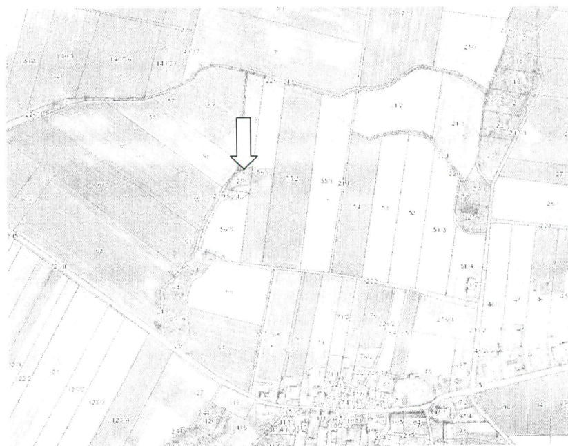
Rysunek 1. Lokalizacja składowiska w Wądrożu Małym

Lokalizację składowiska odpadów będącego przedmiotem karty informacyjnej przedstawiono na rys. 1.